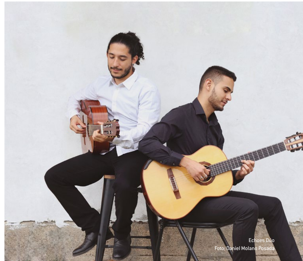
Echoes Dúo

Esperamos que esta convocatoria continúe consolidándose como un espacio fuerte y valioso para los jóvenes músicos del país y que, de esta manera, el Banco de la República siga cumpliendo con su misión de invertir en la construcción, fortalecimiento y puesta al servicio del patrimonio cultural colombiano.