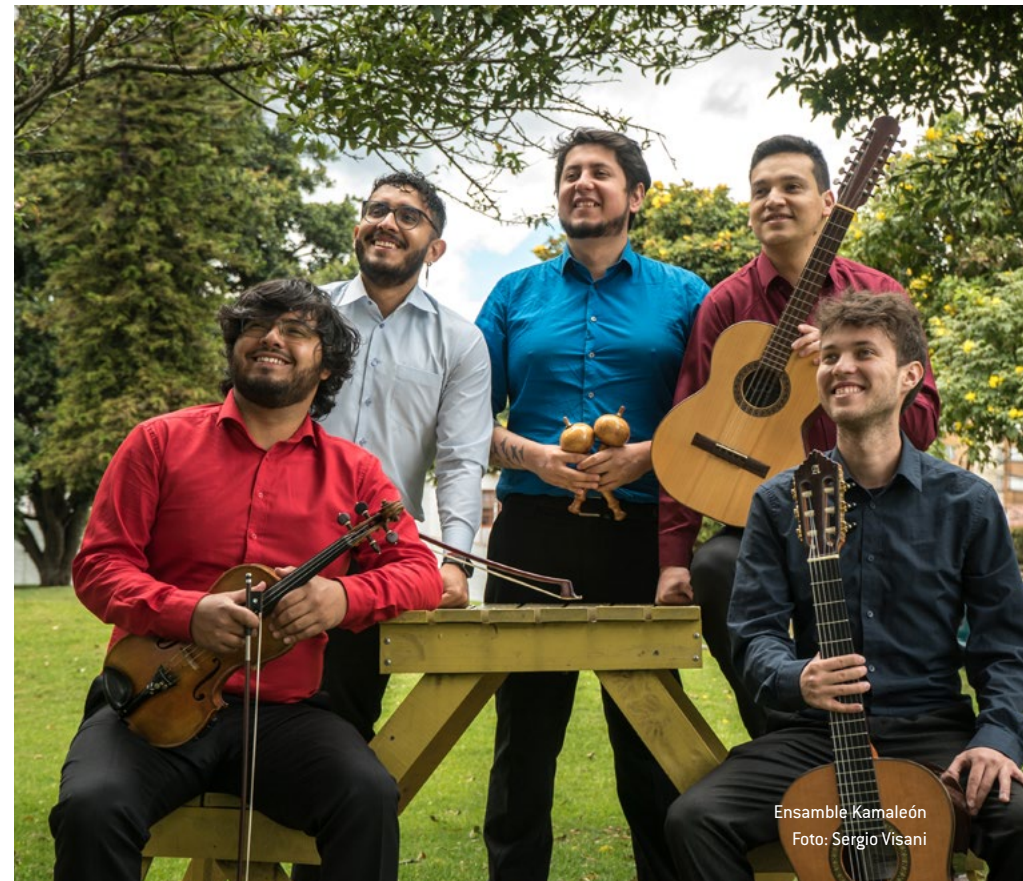
Ensamble Kamaleón

Si su agrupación fue ganadora en las cohortes 2021 o 2023 y no fue seleccionada para continuar el proceso de segundo y tercer año y todos sus integrantes cumplen con el requisito de edad máxima, puede volver a iniciar el proceso de selección.