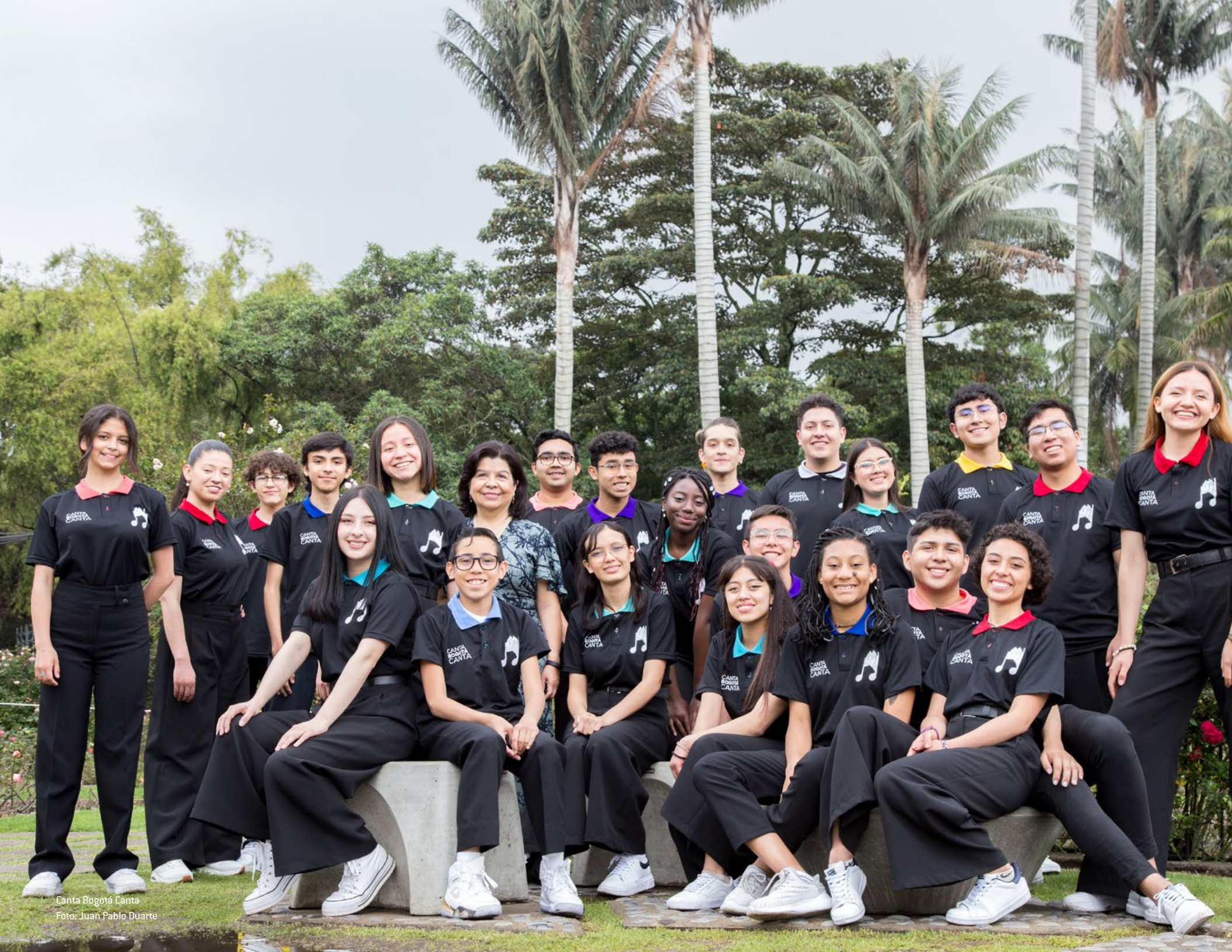
Canta Bogotá Canta