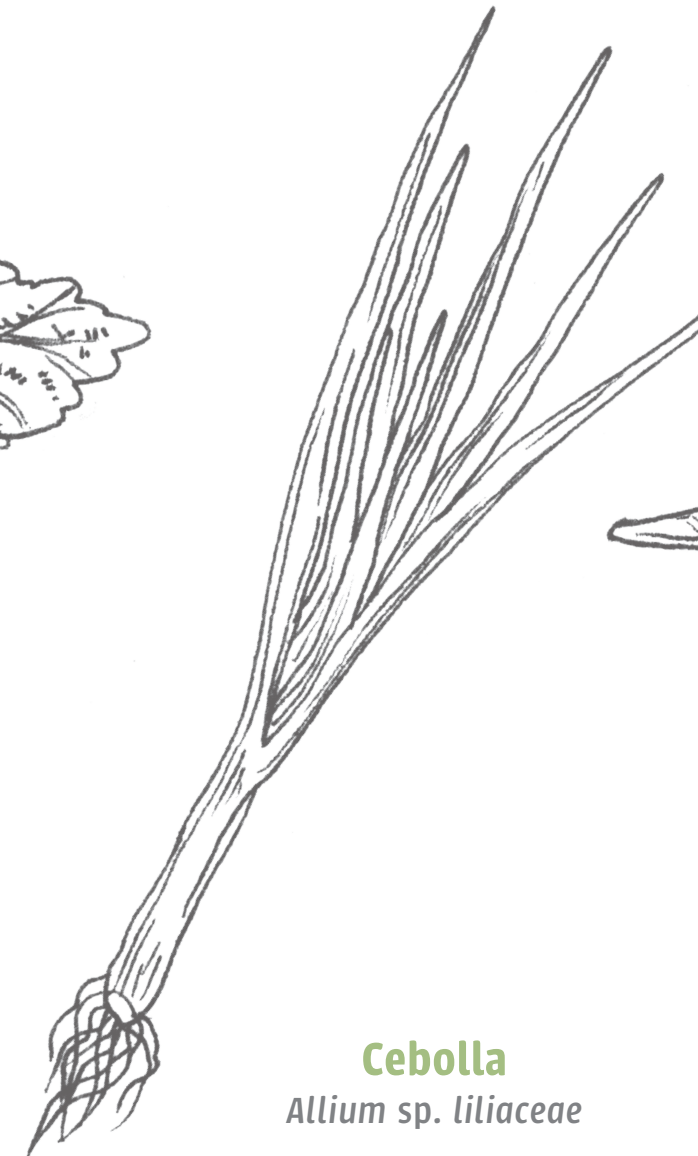
Cebolla Allium sp. liliaceae