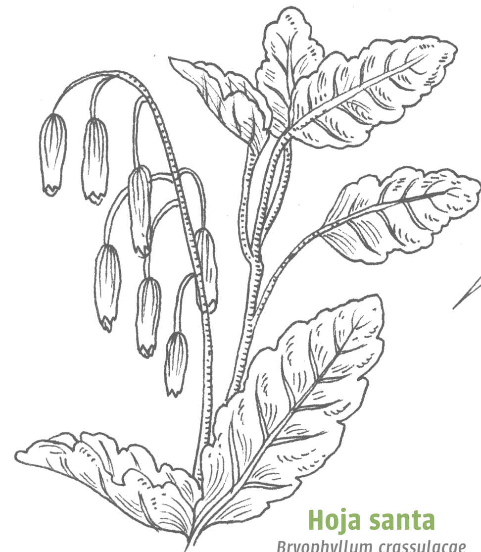
Hoja santa Bryophyllum crassulacae