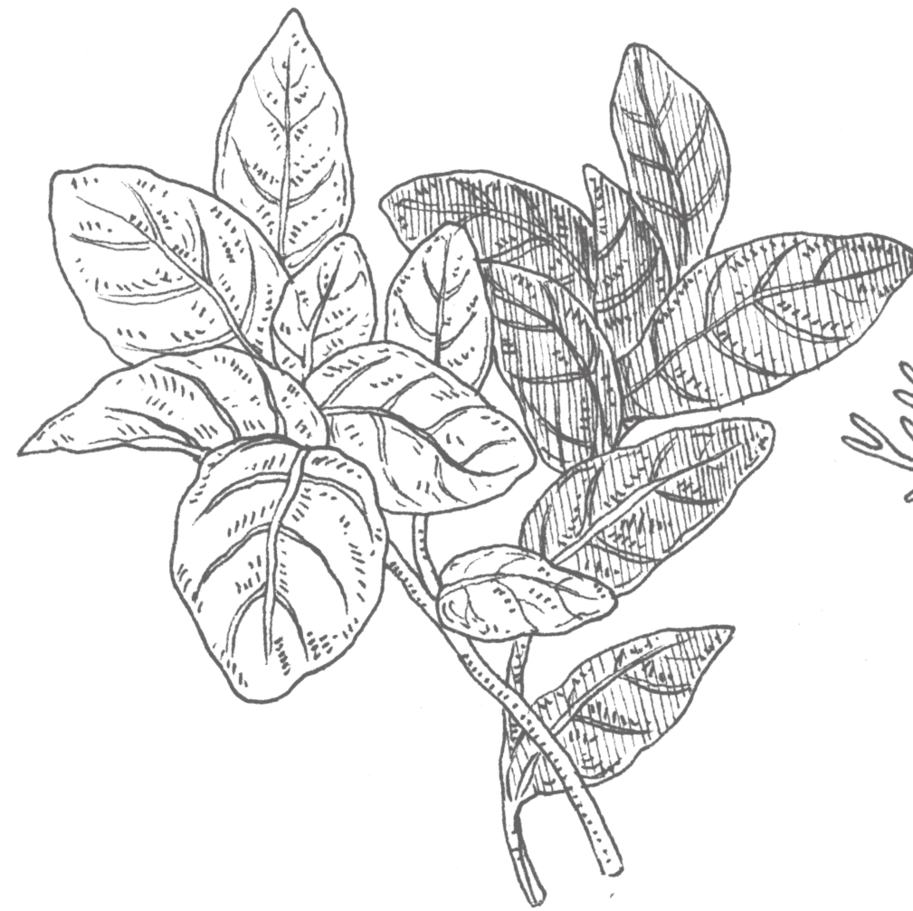
Albahacas blanca y negra Ocimum spp. lamiaceae