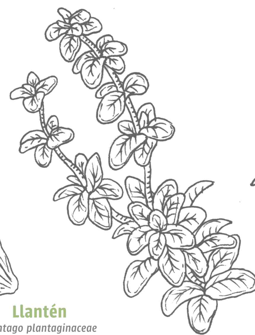
Poleo Satureia lamiaceae