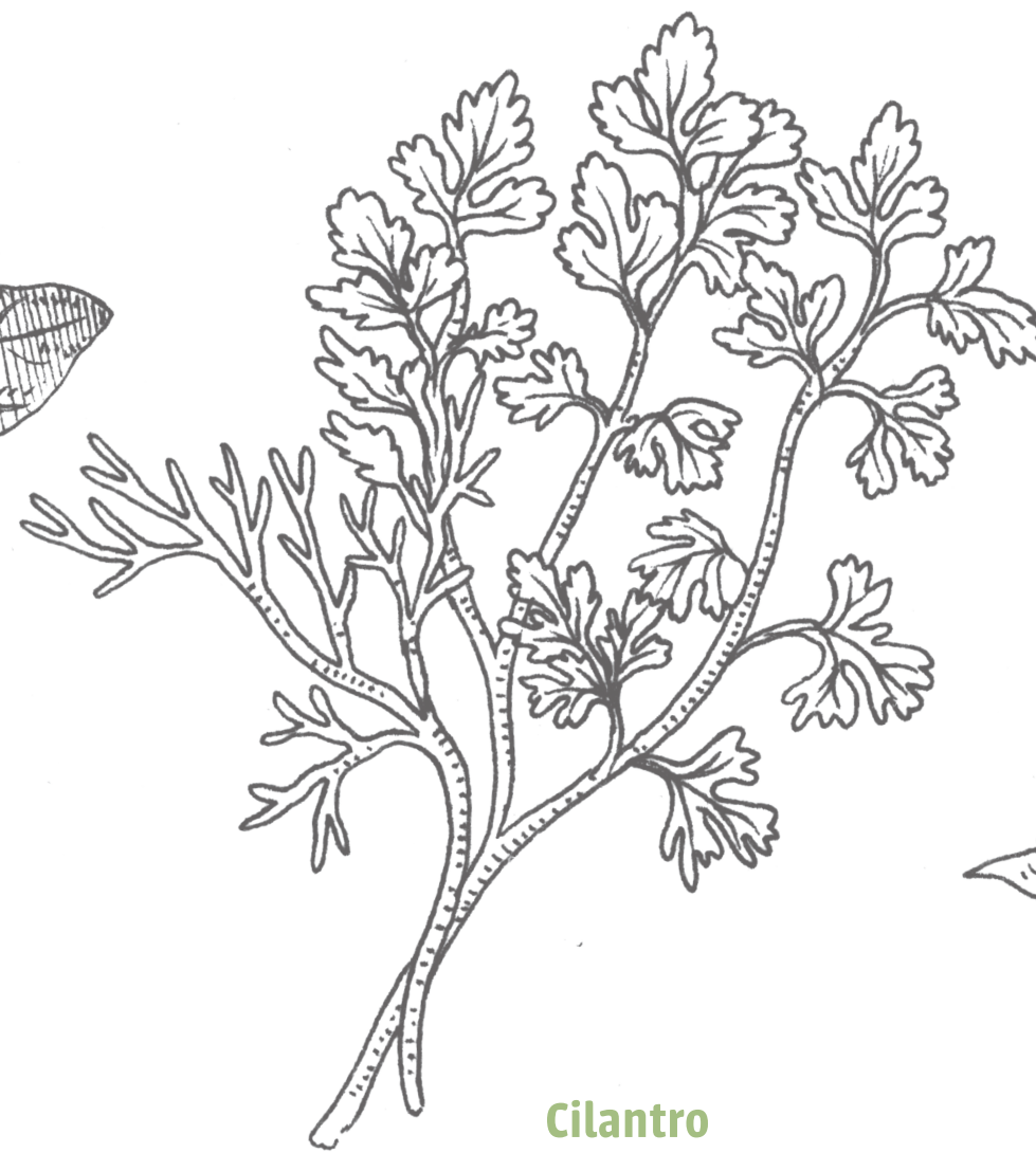
Cilantro Coriandrum sp. apiaceae