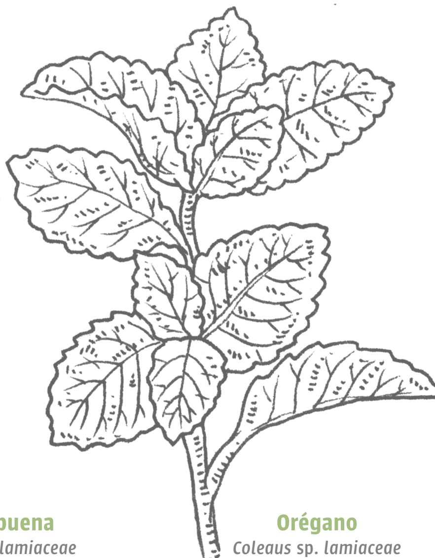
Orégano Coleus sp. lamiaceae