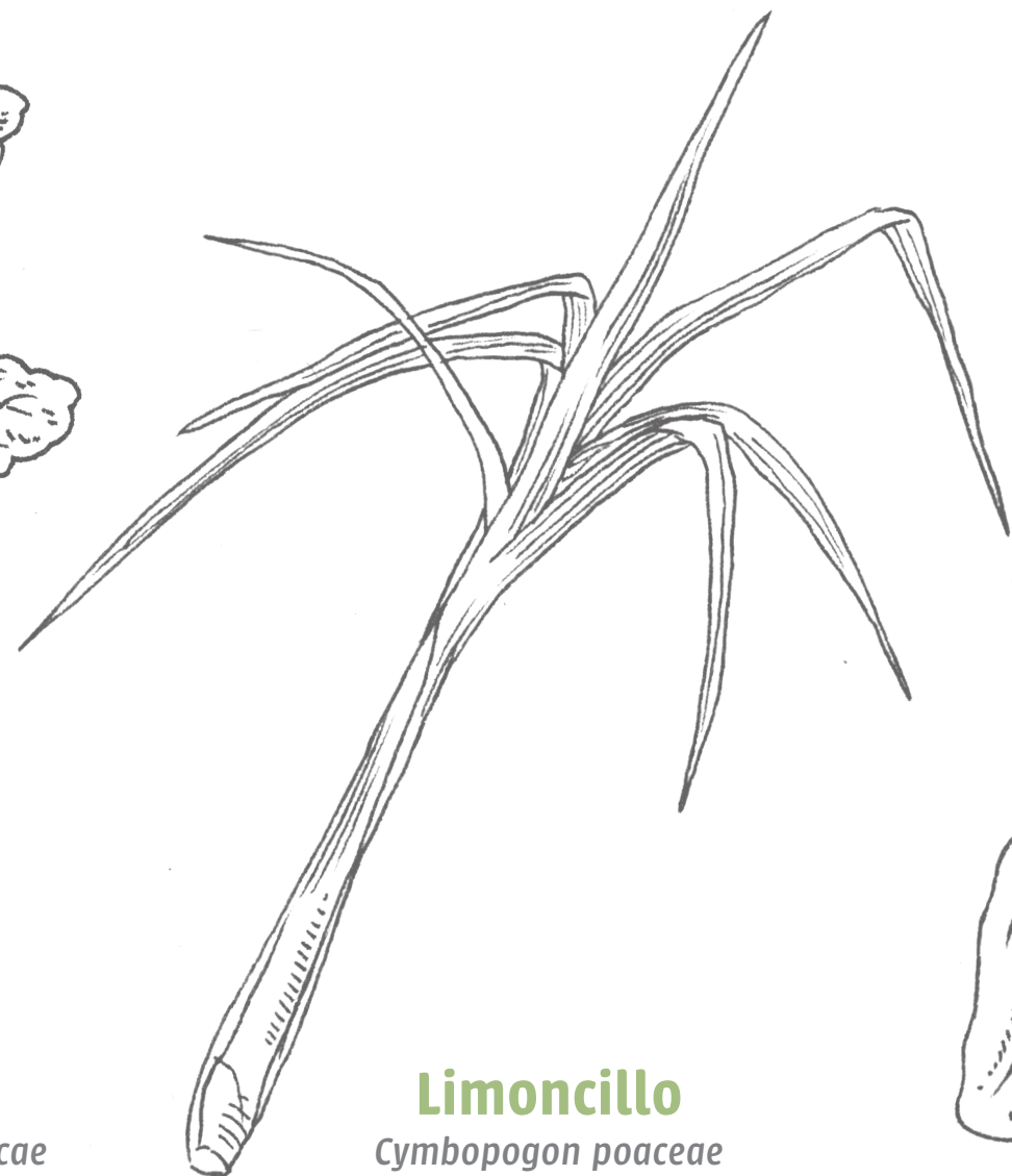
Limoncillo Cymbopogon poaceae