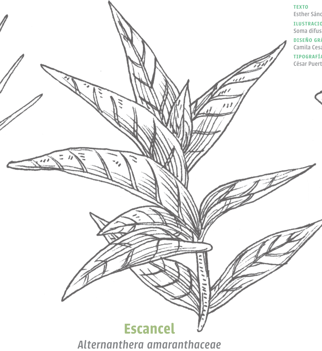
Escancel Alternanthera amaranthaceae