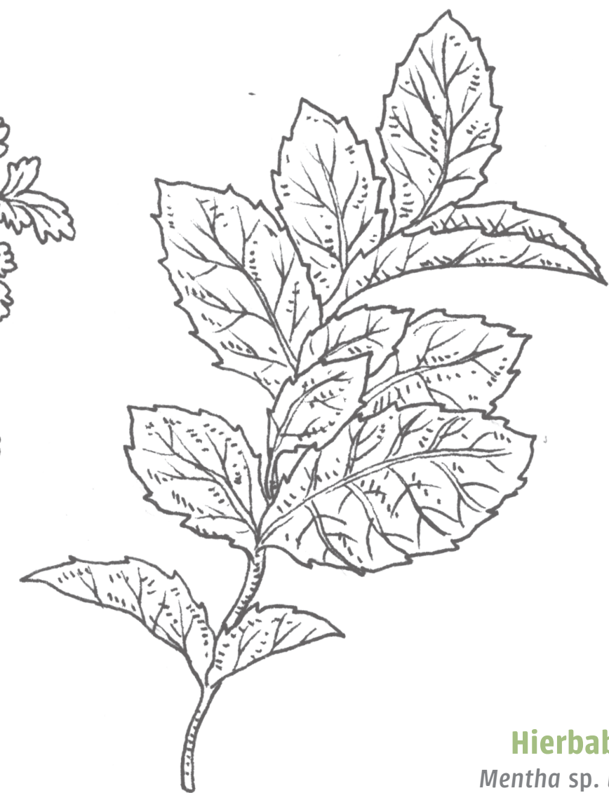
Hierbabuena Mentha sp. lamiaceae