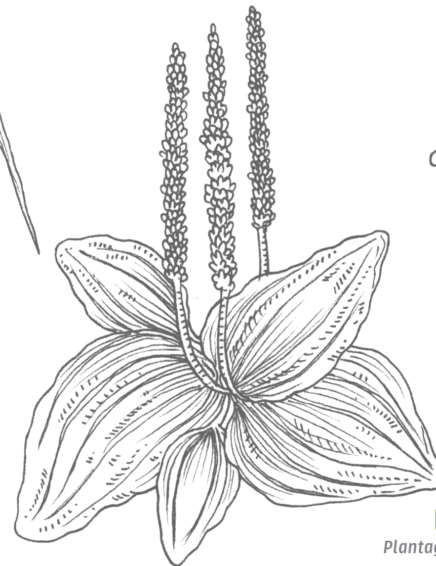
Llantén Plantago plantaginaceae