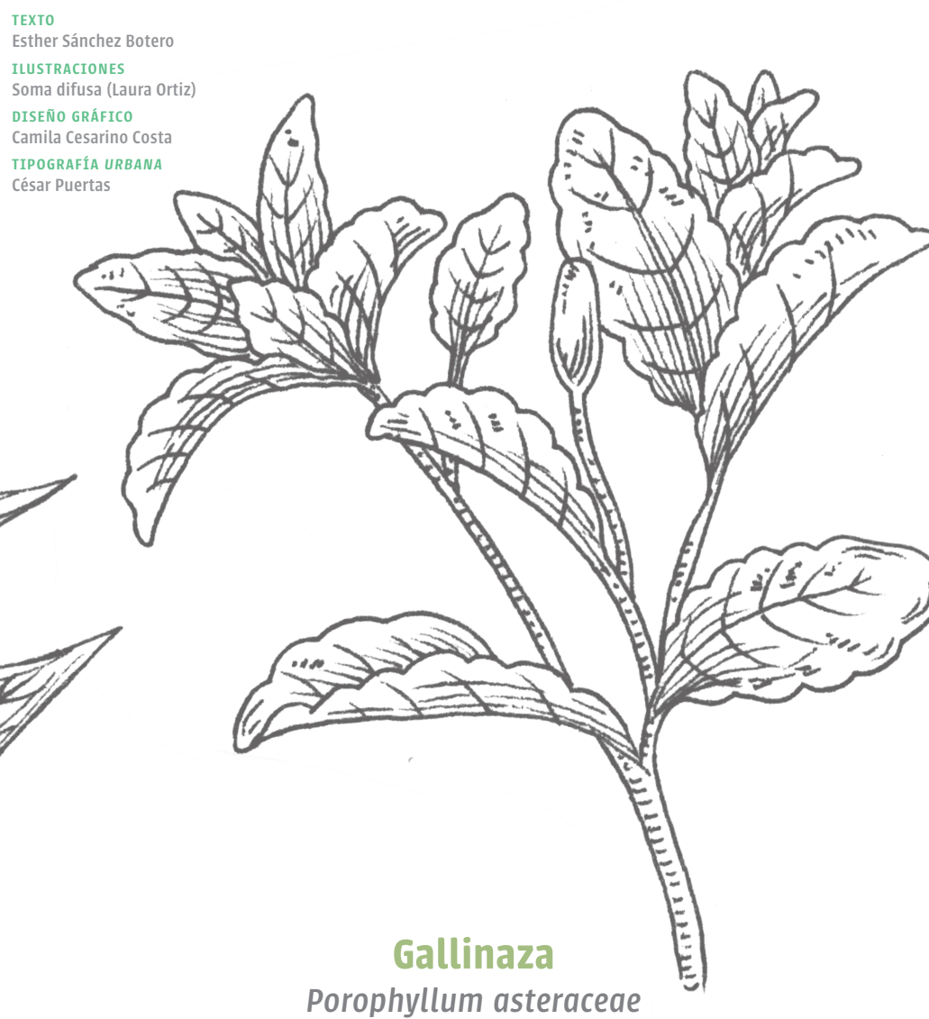
Gallinaza Porophyllum asteraceae

TEXTO Esther Sánchez Botero ILUSTRACIONES Soma difusa (Laura Ortiz) DISEÑO GRÁFICO Camila Cesarino Costa TIPOGRAFÍA URBANA César Puertas