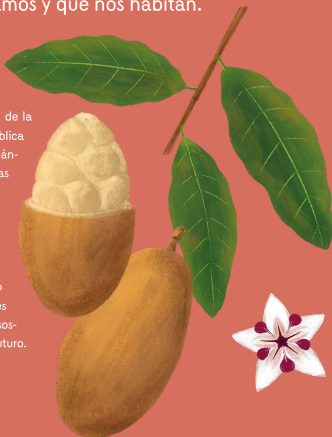
▲ Copoazú ( Theobroma grandiflorum )

El proyecto Semillas, memorias que llevan vida de la Subgerencia Cultural del Banco de la República busca iniciar un intercambio de saberes, desafiándonos a comprender las interconexiones entre las semillas, los procesos alimentarios, la medicina tradicional y su espiritualidad, la autonomía alimentaria, el cambio climático y los aprendizajes que tienen las comunidades para su cuidado y lectura del territorio. También nos invita a reflexionar sobre las semillas como patrimonio biocultural para fomentar diálogos y acciones que nos permitan conectar con su historia y la sostenibilidad que determina nuestro presente y futuro.